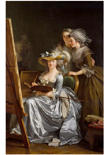
Adélaïde Labille-Guiard, 1785 Αυτοπροσωπογραφία

Χώρος: Αρχοντικό της Βενετούλας, Ντολτσό