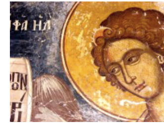
Άγιος Ραφαήλ, Ναός Αγίων Αποστόλων, 16ος αι. Καστοριά

Χώρος: Εθελοντική Εργασία Καστοριάς, Αθ. Διάκου 94