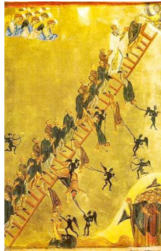
Η Κλίμαξ, 12ος αι. Αγία Αικατερίνη, Σινά